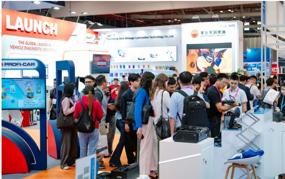
觀眾在 2024 年 Automechanika Ho Chi Minh City 進行業務洽談